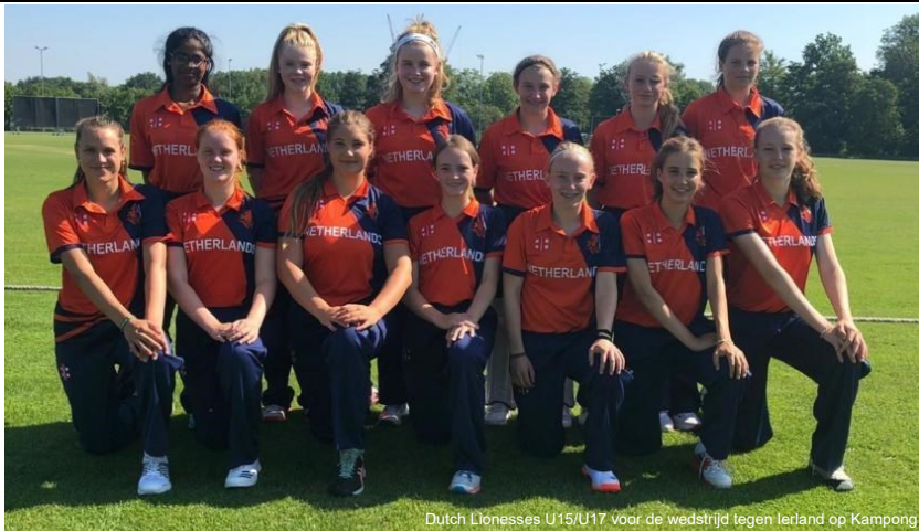
Dutch Lionesses U15/U17 voor de wedstrijd tegen Ierland op Kampong