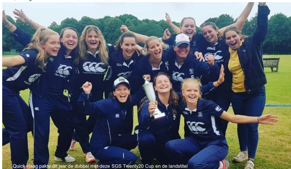
Quick Haag pakte dit jaar de dubbel met deze SGS Twenty20 Cup en de landstitel